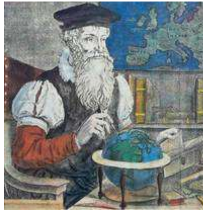
Gerhard Mercator (1512-1594). Ausschnitt aus einer Abbildung im Mercator-Atlas ab 1613

Abbildungen stellen wir Ihnen gerne zur Verfügung!