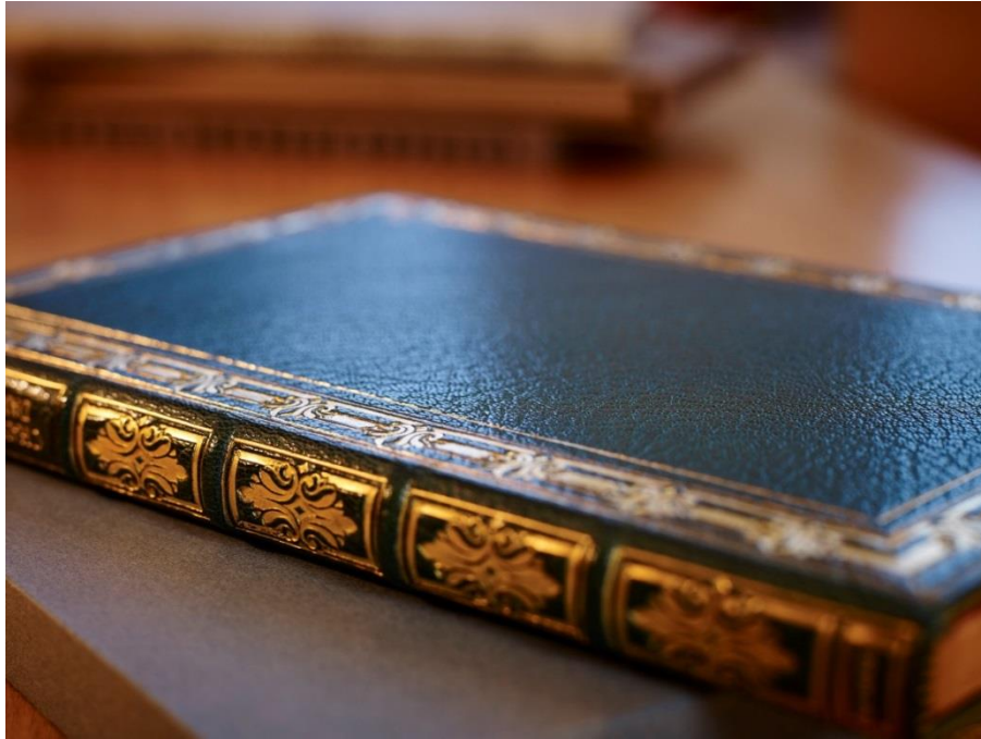
Einband von Frieda Thiersch, Bremer Presse (T. Klinkow Photography, Hamburg).