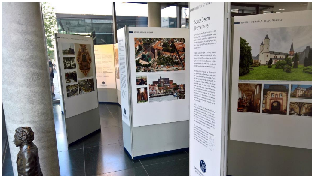
Ausstellung der Deutschen Stiftung Denkmalschutz

Kontakt: Michaela Klinkow M.A., Beauftragte für Öffentlichkeitsarbeit, Landesbibliothek Oldenburg, Pferdemarkt 15, 26121 Oldenburg, Tel.: 0441 / 505018-80, e-mail: klinkow@lb-oldenburg.de