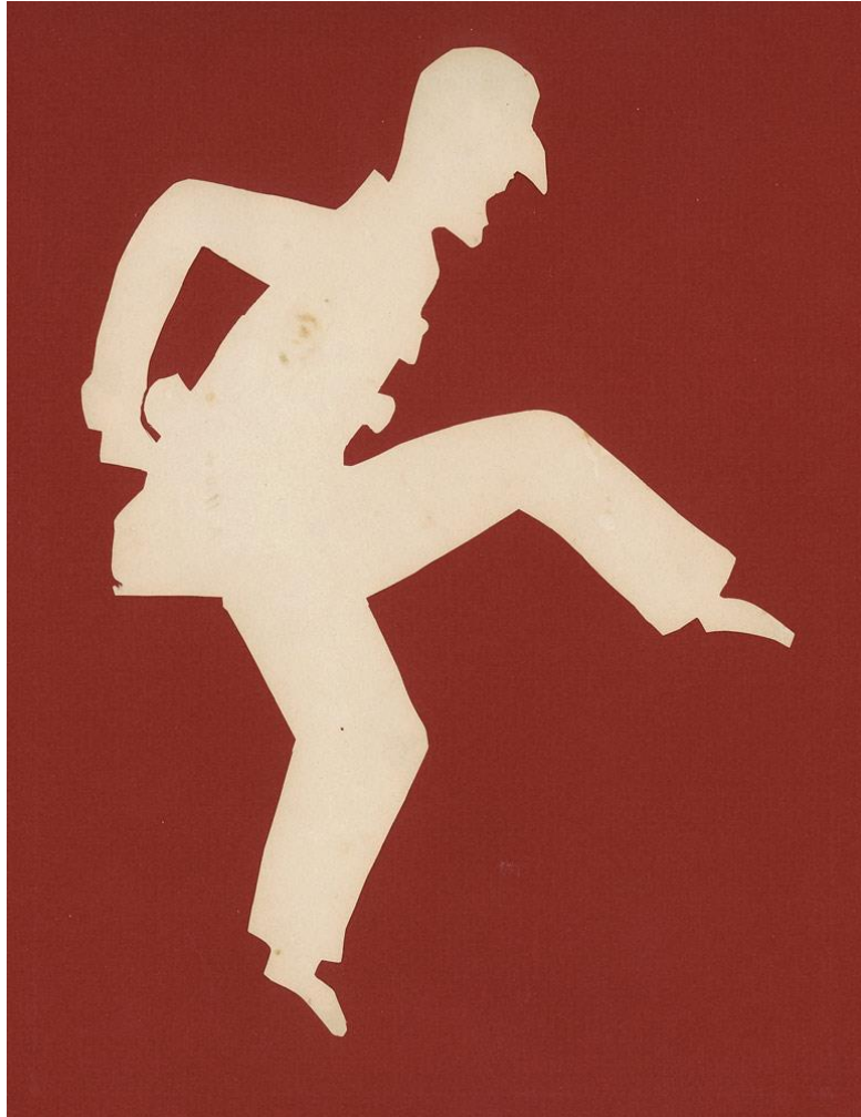
H. C. Andersen: Pierrot (o. J.)