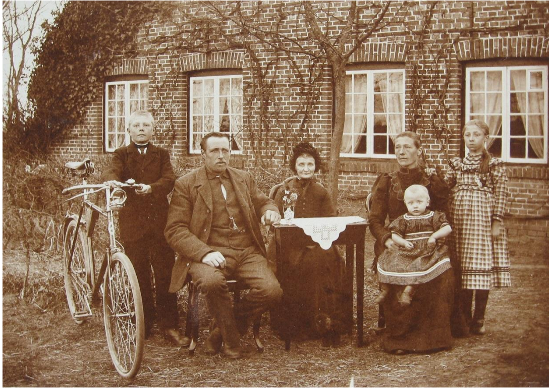
Bäuerliche Familie um 1899 (Abbildung: Wolfgang Martens)