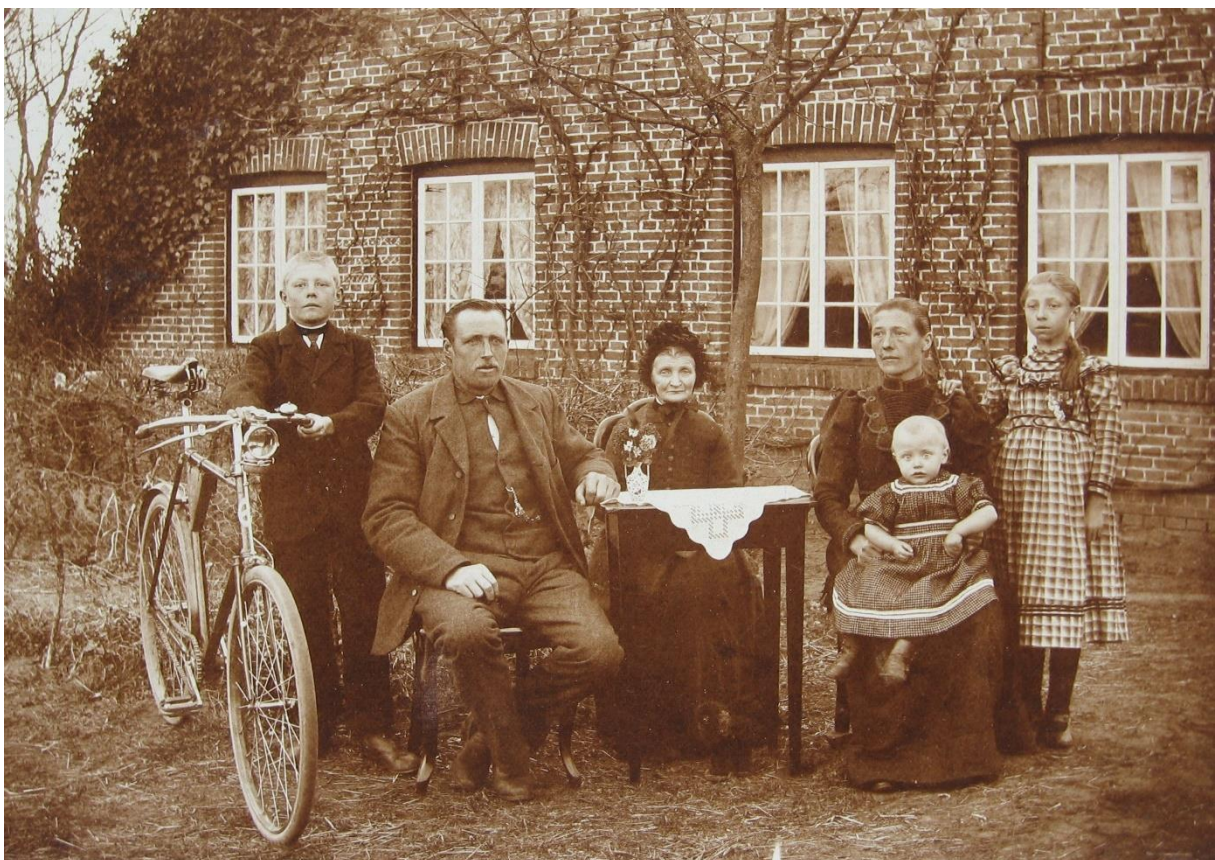
Bäuerliche Familie um 1899

Kontakt: Michaela Klinkow M.A., Beauftragte für Öffentlichkeitsarbeit, Landesbibliothek Oldenburg, Pferdemarkt 15, 26121 Oldenburg, Tel.: 0441 / 505018-80, e-mail: klinkow@lb-oldenburg.de