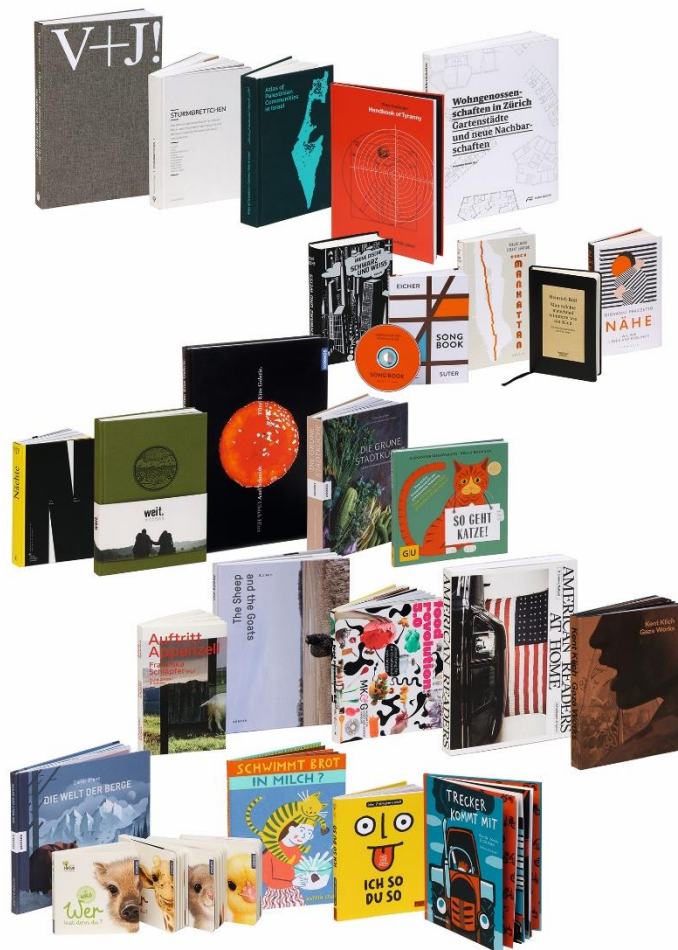
Die schönsten deutschen Bücher 2018