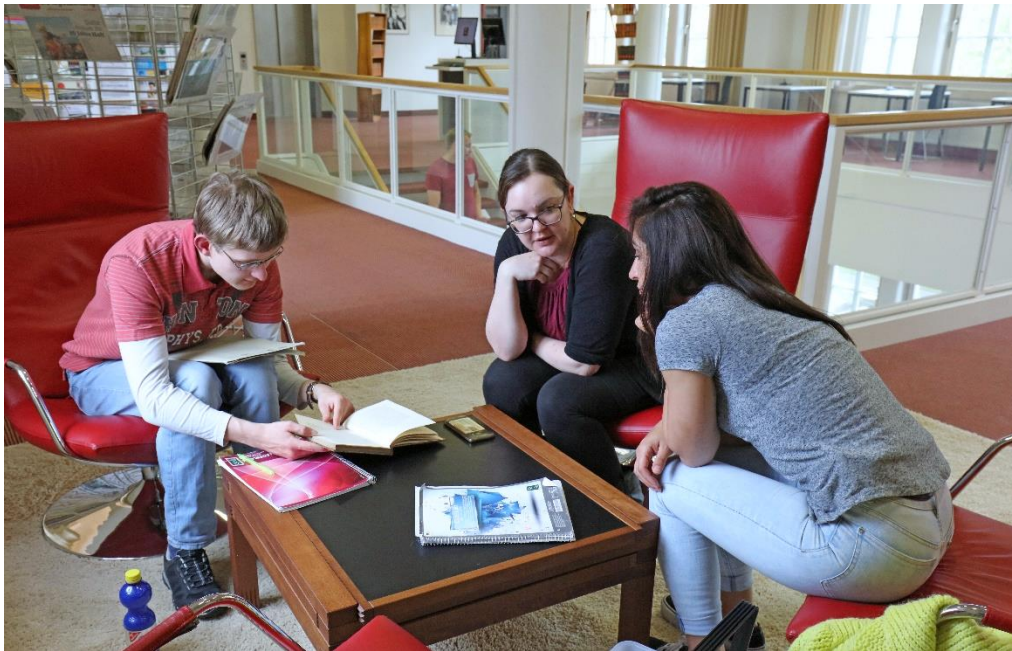
Studierende im LIZ der Landesbibliothek.