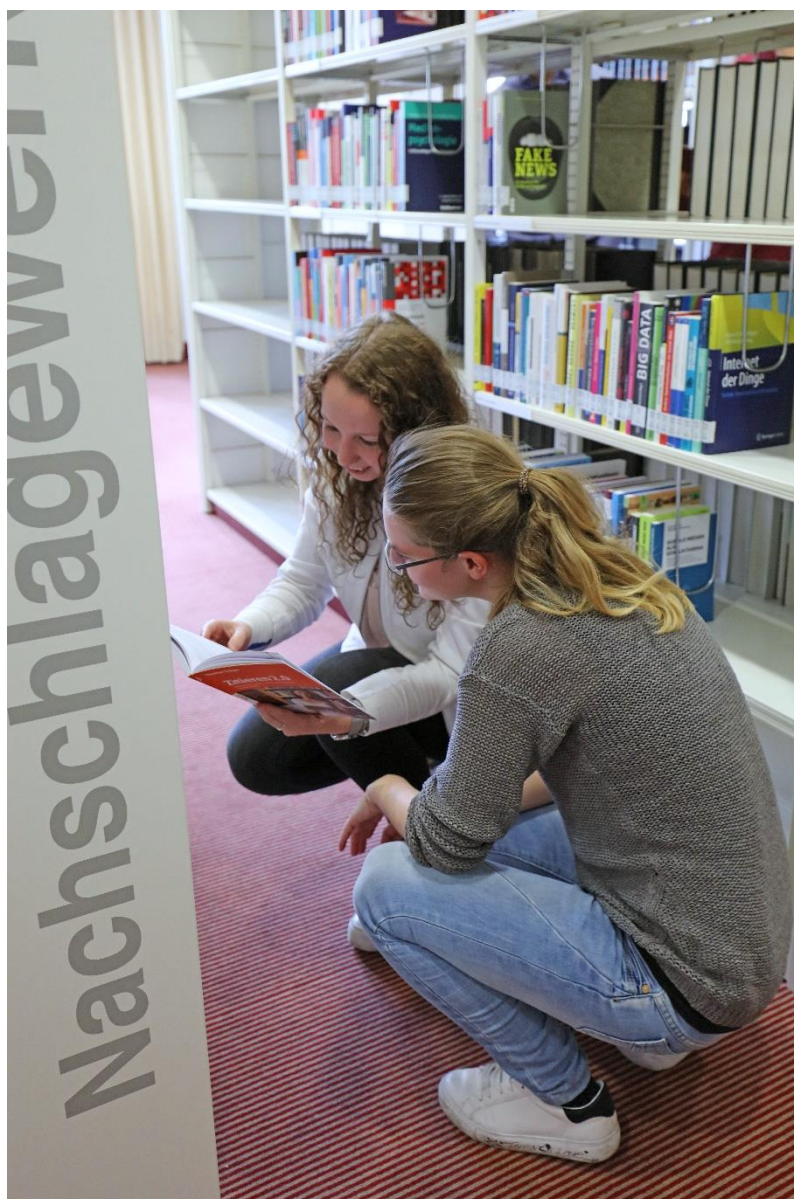
Im LIZ der Landesbibliothek.