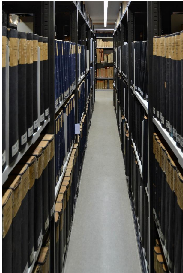
Ein Zeitungsmagazin der Landesbibliothek.

Diese und weitere Abbildungen stellen wir Ihnen gerne auch digital zur Verfügung.