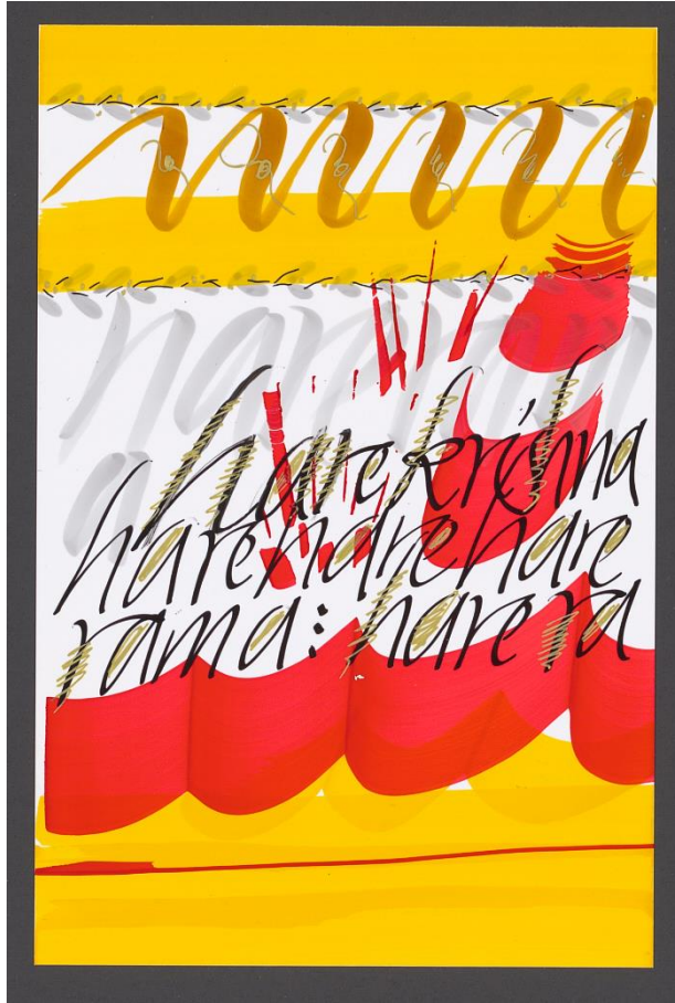
aus dem Künstlerbuch „Indische Reise“