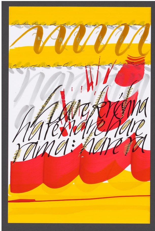
aus dem Künstlerbuch „Indische Reise“