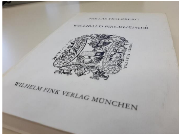
Abbildung 2: Habilitationsschrift „Willibald Pirckheimer – Griechischer Humanismus in Deutschland.“