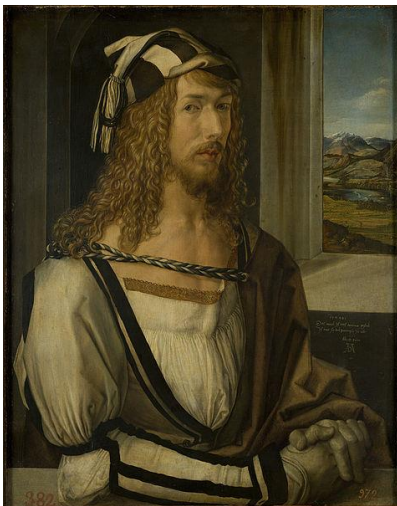
Abbildung 3: Albrecht Dürer: Selbstporträt. Öl auf Holz. 520 x 410 mm. Museo del Prado, Madrid.