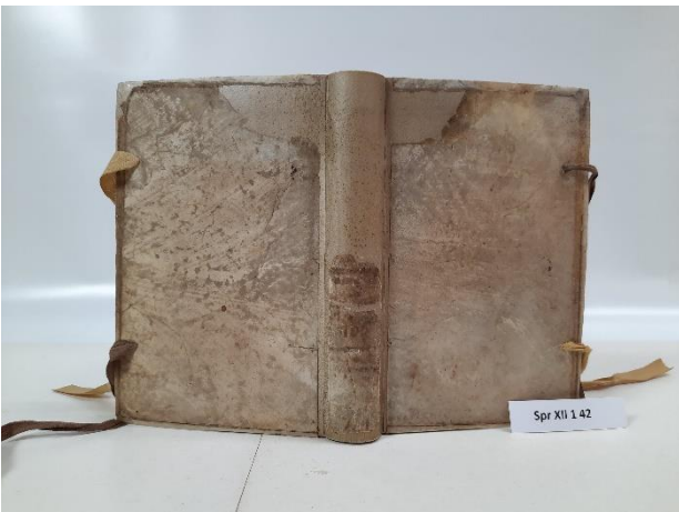
Abbildung 3: Nach der Restauration: Regeneriertes und ergänztes Einbandmaterial, stabilisierter Buchrücken.