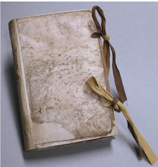
Abbildung 5: Neue zweifarbige Bindebänder zieren das restaurierte Buch.